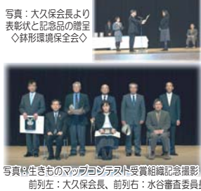
写真：大久保会長より表彰状と記念品の贈呈 ◇緑形環境保全会

地域環境に対する住民の意識醸成や保全に向けた取組を促進するとともに、多くの県民の皆様にとちぎの豊かな農村環境を知っていただくため、県協議会の主催により実施した「平成22年度田んぼまわりの生きものマップコンテスト」の受賞組織が決定しました。114組織から応募があり、昨年12月24日（金）に行われた審査会で6作品が受賞作品に選ばれました。また、2月2日（水）～3日（木）には県総合文化センター第2ギャラリーで作品展を開催するとともに、3月9日（水）には小山市立文化センター大ホールで表彰式を行いました。