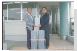
ナタネ油を学校給食へ寄贈