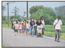
地域外の方も参加した「那須疏水&田園ウォーク」