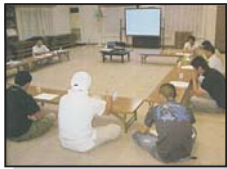
若手農家の会合による話し合い「三区町の未来を考える会」