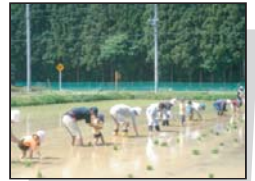
田んぼオーナーによる田植え