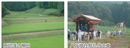
益子町山本の風景

当該認定地には、農地・水・環境保全向上対策に取り組む地域が数多く含まれており、活動組織の皆様これまでの取組成果が評価されたものと考えております。この田園風景百選を契機に、多くの方々の参加を得て、なお一層、保全に向けた取組を充実させていきましょう。