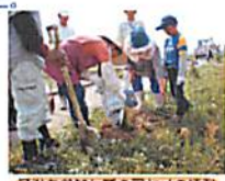
子供も参加してのアヤメの植栽