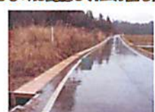
（例）カエル蓋の設置