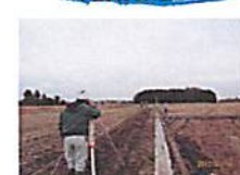
【構成員も立会いで完成検査】