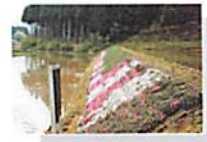
カバープランツの例 【シバザクラ】