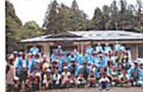
上大貫上環境を守る会の皆さん