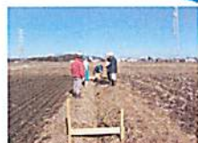
【地権者の立会いにより高さ確認】